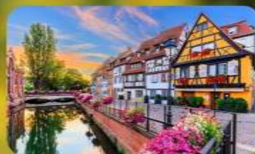
ดินแดนแห่งเทพนิยาย กอลมาร์