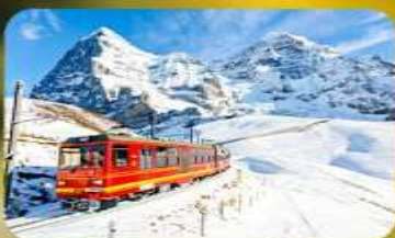
พิชิตยอดเขาจุงเฟรา

พักที่ Pullman Paris Tour Eiffel Hotel พิเศษ !!! ห้องละเตียงวิวทิวทัศน์ หรือ-คืนเทียบเท่า